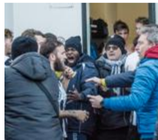
NERVI TESI Dopo il ko del Fanfulla