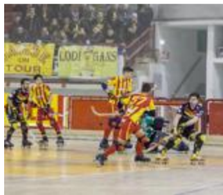
LA SFIDA L'Amatori sugli scudi

CALCIO ■ PARI PER IL BANO, SANT'ANGELO AL TAPPETO