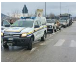
LA COLONNA Il gruppo lodigiano

Si sono dati appuntamento alle quattro di notte al casello di Guardamiglio e sono arrivati alle 14.20 a Coppito, in provincia de L'Aquila, dopo essere stati salutati da una fitta pioggia e cumuli di neve alti due metri a lato della strada prima del traforo del Gran Sasso, e accolti da un tiepido sole e raffiche di foehn all'arrivo sul versante meridionale. Sono i venti volontari della protezione civile della Provincia di Lodi mandati in Abruzzo a dare il cambio ai colleghi della Provincia di Cremona, sul posto da una settimana.